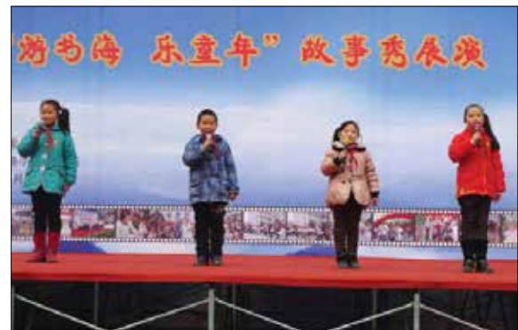
مدرسه‌ای ابتدایی در شانگهای

آشنایی با این برنامه می‌تواند برای کتابداران آموزشی مناسب باشد. در اینجا چکیده‌ای از گزارش گوردون ارائه می‌شود.