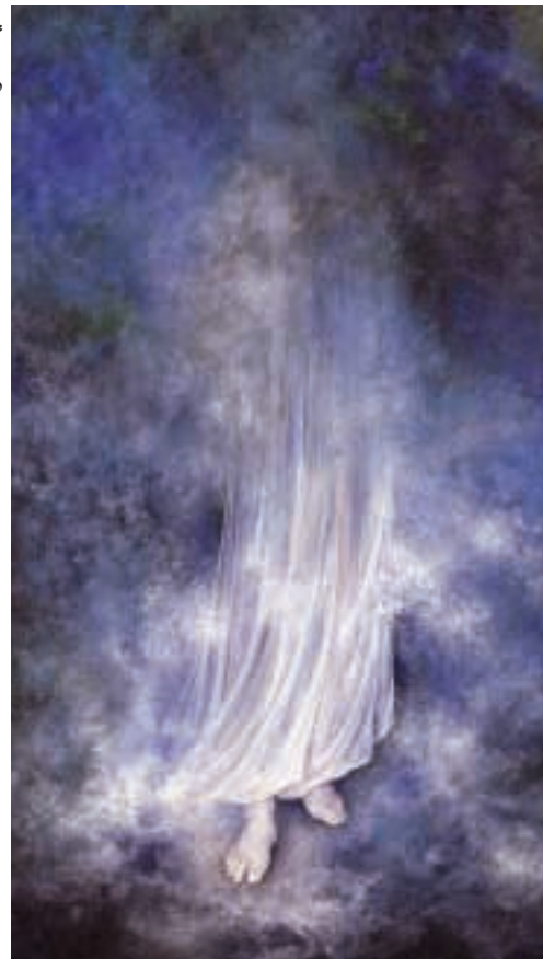
■ امید (خواهد آمد)

نقاشی ایرانی بیش از آن‌که با طبیعت مأنوس و وابسته باشد، دل‌بسته‌ی گسترش اندیشه و عالم نامحسوس است که بی‌نهایت خیال را به حالتی دلپذیر تجلی و شکل می‌دهد و هنرمند برای این‌که تحولات و رنگارنگ زندگی مادی، یاری دستیابی به دنیای او را پیدا نکند، برای نمودهای خود معنویتری فراتر از عوامل زندگی گذرا قایل می‌شود؛ زیرا هنری ماندگار و جاوید است که به مفاهیم انسانی و کلی وفادار باشد.