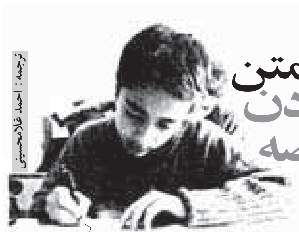
ترجمه: احمد غلامحسینی

خلاصه‌ای دقیق و روشن را به آغاز یا پایان هر فصل کتاب مخصوص دانش‌آموزان بیفزاییم.