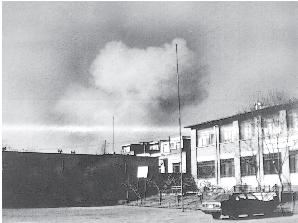
این عکس در روز ۱۲ بهمن ۱۳۶۵ از حیاط مرکز تربیت معلم خدیجه کبری (میانه)، نزدیک ظهر، در لحظه‌ی بمباران دبیرستان زینبیه گرفته شد.

بعد از برگشتن از تهران، برای این‌که بتوانم به امتحانات ترم برسم، ماندن در خوابگاه را به رفتن به تبریز ترجیح دادم و چون وسایل ارتباطی مانند امروز به سهولت در دسترس نبود، برای اطلاع دادن به خانواده‌ام، به مرکز مخابرات میانه که در یکی از میدان‌های اصلی شهر قرار داشت، رفتم. میانه شهر کوچکی بود و تربیت معلم تا مخابرات، فاصله‌ی چندانی نداشت.