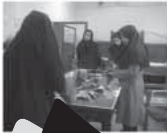
مس علامت‌گذاری و رنگ شده برای پولک‌ها