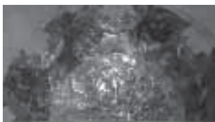
بخشی از تاج در (نمای بیرونی)