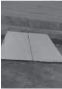
در تالار پذیرایی قبل از بازسازی هنری