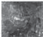
لچکی بالای در و زه برنجی اطراف درها