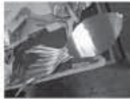
قطعات بریده شده از مس خام