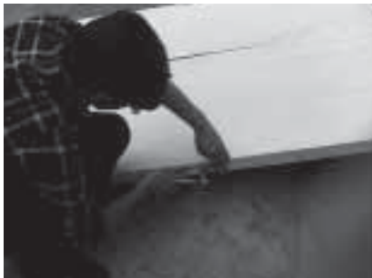
پر کردن محل قفل و دستگیره در به منظور جایگزینی آن با دستگیره و قفل سنتی