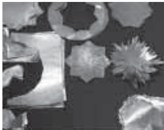
واگیره‌های تهیه شده از مس و برنج