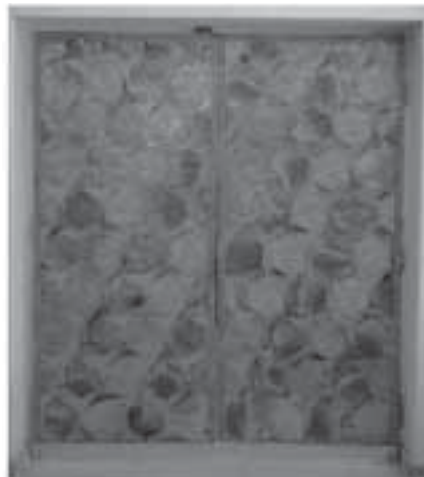
نمای داخلی درها