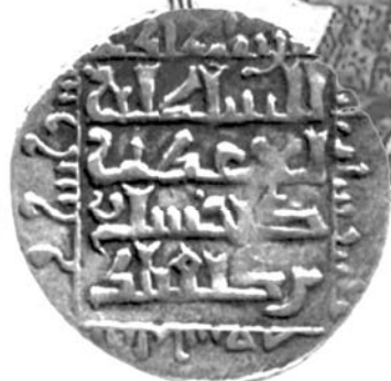
سکه دوره سلجوقی