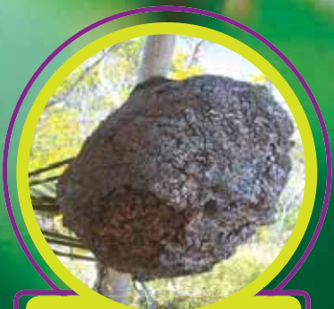
لانه موریانه‌های درختی