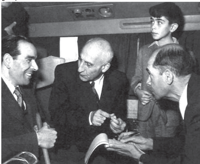
دکتر فاطمی در کنار دکتر مصدق