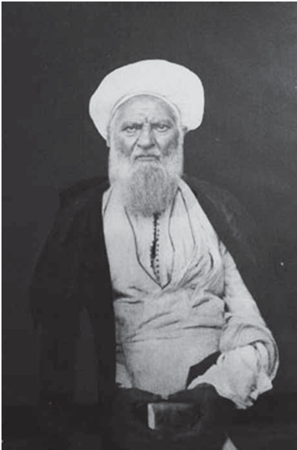
حاج شیخ عبدالکریم حائری یزدی