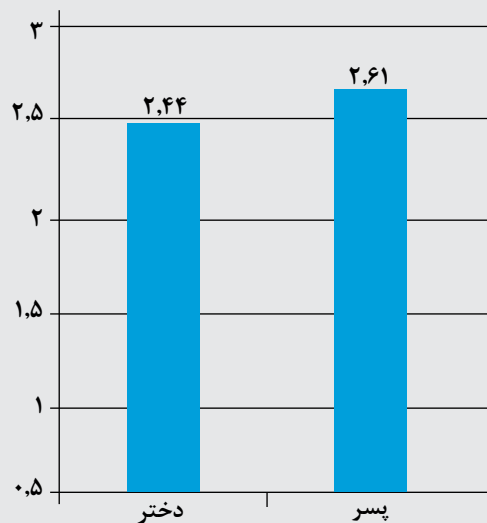
نمودار ۱. میزان بی انگیزگی دانش آموزان در فعالیت های تربیت بدنی مدارس

تأثیر بگذارد. دانش آموزانی که دارای تجربه مثبت در فعالیت های جسمانی هستند، ممکن است بخواهند این فعالیت ها را ادامه دهند. برعکس، دانش آموزانی که احساس کنند در یک فعالیت ناموفق هستند، از تربیت بدنی لذت نمی برند و ممکن است نخواهند مشارکت شان را ادامه دهند. اگر هدف از تربیت بدنی ارتقای فعالیت بدنی در طول عمر است، برای دانش آموزان داشتن یک تجربه لذت بخش اهمیت دارد. بنابراین، بررسی تجارب دانش آموزان مناسب است و می تواند اطلاعات ارزشمندی به دست دهد [۴]. در تحقیقی که روی ۳۸۱ نفر ۱۸۰ دختر و ۲۰۱ پسر از دانش آموزان دوم و سوم دوره متوسطه در شهرستان بوکان صورت گرفت، میزان و دلایل بی انگیزگی دانش آموزان برای شرکت در فعالیت های تربیت بدنی مدارس مورد بررسی قرار گرفت. در این تحقیق از «پرسش نامه بی انگیزگی در تربیت بدنی» (AI-PE) شن ۱ و همکارانش (۲۰۱۰) استفاده شد که میزان بی انگیزگی (از هیچ وقت=۱ تا همیشه=۵) و سپس دلایل بی انگیزگی را در چهار مؤلفه کمبود توانایی، تلاش نامناسب، ارزشمند نبودن فعالیت و جذاب نبودن فعالیت های تربیت بدنی، مورد ارزیابی قرار می دهد [۱۳]. نمودار میزان بی انگیزگی را در دانش آموزان دوره متوسطه به تفکیک جنسیت نشان می دهد.