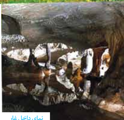
نمای داخل غار

از مهم‌ترین جاذبه‌های دیدنی دیواندره، به طول ۷۵۰ و ارتفاع ۱۰۰ متر از سطح زمین که برای رسیدن به آن ۱۸۰ پله را باید طی کرد. دارای چهار طبقه در دل صخره‌ای بزرگ است. مربوط به دوره اشکانیان است و نقاشی‌هایی از حیوانات، انسان‌ها و گیاهان روی دیوار حکایت از آن دارد که در دوران‌های مختلف انسان‌ها در آن سکونت می‌کردند. جزو زیباترین غارهای طبیعی و دست‌ساز بشری است به طوری که هر طبقه اتاق‌ها، راهروها و دالان‌های زیادی دارد که به هم متصل هستند. در مسیر طولانی غار، حوضچه آب راکدی وجود دارد و ستون‌های آهکی مانند نگهبانانی از غار محافظت می‌کنند.