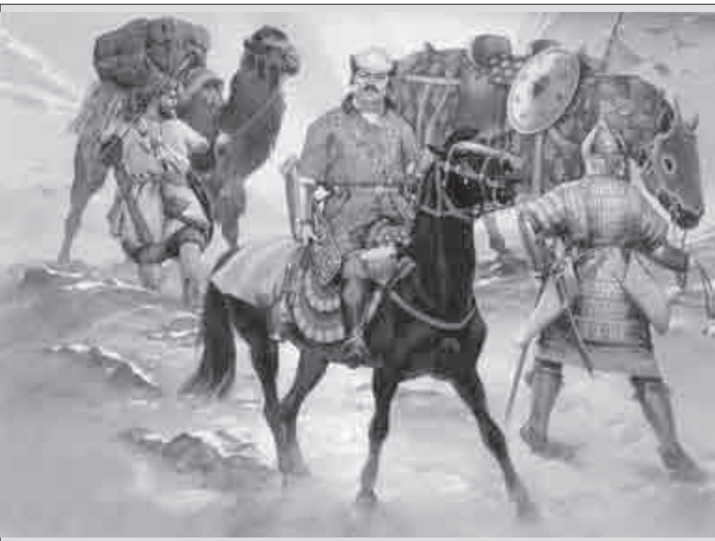
تاجر دوره‌ی تیموری

امیر شاه‌ملک، از امرای بزرگ تیمور که بعدها به خدمت شاهرخ درآمد از سوی او خوارزم را در سیورغال خود داشت.