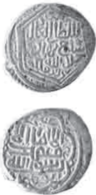
سکه دوره تیموری

هجوم وحشتناک امیر تیمور (۸۰۷-۷۳۶ هـ.ق) به ایران به نحوی تکرار حملات بنیان‌کن مغول‌ها بود. تیمور علاوه بر این که کوشید منافع خود و لشکریانش را طی یورش‌های مکرر تأمین کند، سعی نمود با غارت مناطق مفتوحه، سرزمین ماوراءالنهر، به‌ویژه سمرقند پایتخت خود را ترقی دهد. از این رو با انتقال هنرمندان، معماران، پیشه‌وران و... از شهرهای مختلف ایران به پایتخت، سمرقند را به شهری آباد تبدیل کرد. به‌هر حال، از حملات تیمور جز تخریب و ویرانی و غارت منابع، چیز دیگری عاید شهرهای ایران نشد. اما فرزندش شاهرخ، از همان ابتدای به حکومت رسیدن، در صدد جبران ویرانی‌های ناشی از حملات پدر برآمد. دوران حکومت وی آرامش و امنیت نسبی به همراه آورد. پادشاهی رعیت‌دوست بود و تا حد امکان به عمارت و بازسازی شهرها و روستاها و اماکن تخریب شده همت گماشت. رونق اقتصادی و رفاه و آرامش ایجاد کرد و پایتخت خود هرات را به شهری آباد و مرکز علما و هنرمندان تبدیل ساخت؛ این امر نه تنها در هرات بلکه در شهرهای دیگر قلمرو شاهرخ از جمله سمرقند و شیراز نیز، به دلیل وجود شاهزادگانی که در این شهرها حکومت می‌کردند، به چشم می‌خورد. شاهزادگان تیموری مردانی فرهنگ‌دوست بودند. از این رو در صدد بودند شهرهای محل حکومت خود را آباد سازند تا پشتوانه‌ی اقتصادی لازم را در جهت فعالیت‌های سیاسی و فرهنگی خویش ایجاد کنند. به همین دلیل اوضاع اقتصادی ممالک تحت حکومت شاهرخ در غالب بخش‌های آن، از قبیل تجارت و کشاورزی، رو به پیشرفت گذاشت که خود موجب بالا رفتن سطح رفاه عمومی و توسعه‌ی علمی، فرهنگی و هنری قلمرو او گردید. در ادامه شاخه‌های مختلف فعالیت‌های اقتصادی عصر شاهرخ را مورد بررسی قرار می‌دهیم.