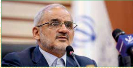
محسن حاجی میرزائی، وزیر آموزش و پرورش