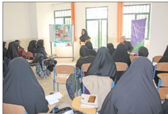
تشکیل کلاس‌هایی با حضور نویسندگان و دانش‌آموزان برگزیده کشور