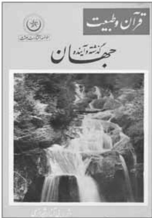
تصویر ۷ روی جلد قرآن و طبیعت کتابخانه‌های علمی یا نگرشی مذهبی انتشارات بعثت، ۱۳۵۲

«انتشارات بعثت» در سال‌های اولیه دهه ۵۰ منتشر شده است. از این مجموعه می‌توان «راز کوه‌ها»، «زنبور عسل»، «مسافرت به فضا»، «گذشته و آینده جهان» و ... را نام برد.