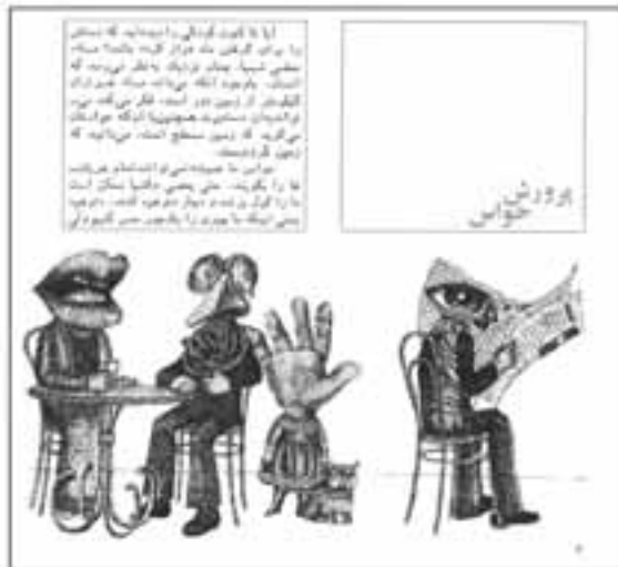
تصویر ۶. کتاب آنچه می‌خواهید بدانید نقاشی‌های خیال‌انگیز که هدف معینی را دنبال می‌کنند. «آن چه می‌خواهید بدانید». «کانون» ۱۳۵۲.

بدون شک می‌توان کتاب‌ها و ناشران بسیار دیگری را به آنچه ذکر کردم، اضافه کرد. همان‌طور که در ابتدا نیز اشاره کردم، نخواستیم تاریخچه کامل و علمی از موضوع ارائه کنیم. تنها گشت‌وگذاری در خاطره‌های آن دوران کرده‌ام. این خاطره‌ها را با یادی از مجموعه «قرآن و طبیعت» به پایان می‌برم. مجموعه‌ای که نگاه به آفرینش و طبیعت و عجایب و شگفتی‌های آن را با نگرش مذهبی درهم می‌آمیزد و آیه‌هایی از قرآن مجید را که می‌تواند به موضوع مربوط و یا اشاره به آن داشته باشد، همراه می‌آورد. این کتاب‌ها دارای عکس‌ها و تصویرهای رنگی و سیاه و سفید است. آیات قرآن بالای تصاویر جای دارند و ترجمه آیات در پایین تصاویر آمده است. این مجموعه توسط عبدالکریم بی‌آزار شیرازی تألیف و به وسیله