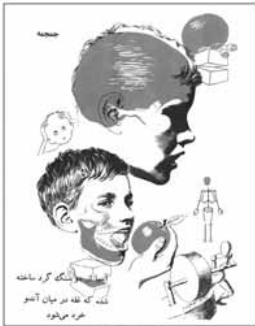
تصویر ۳: صفحه ۱۸ از کتاب شگفتی‌های آدمی تصویرهای گویا و سساده همراه با تمثیل شگفتی‌های آدمی انتشارات پدیده - ۱۳۴۵

چند مجموعه کتاب‌های پدیده، تصویرهای کتاب «شگفتی‌های تن آدمی» که توسط حسن مرنندی ترجمه شده بود، ویژگی منحصر به فردی داشت. تصویرگر و نویسنده کتاب آنتونی راوبلی است. به نظر می‌آید که نویسنده با دانش لازم تصویرهای کتاب را ترسیم کرده است، زیرا تصویرها از دقت علمی برخوردارند. تصویرهای ساده کتاب که در زمینه‌ای با رنگ متفاوت چاپ شده‌اند، به خوبی خواننده را به خود جذب می‌کنند و او را به درک درست از آناتومی و عمل اندام‌های مختلف بدن می‌رسانند. از دیگر ویژگی‌های این تصویرها تمثیل‌هایی است که درک موضوع را آسان می‌کنند. این روش امروزه کاربردهای زیادی یافته است. در تصویر ۳ صفحه‌ای از این کتاب را مشاهده می‌کنید که با تمثیل کار دندان‌ها به آسیاب همراه است.