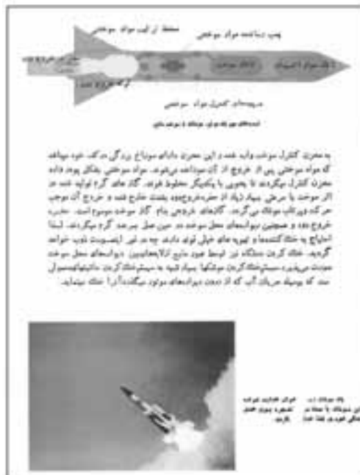
تصویر ۲: کتاب فضا صفحه ۲۶ صفحه‌ای از کتاب فضا از مجموعه‌ی کتاب‌های مرجع هفتگی این مجموعه‌ها ترجمه بود.

«کتاب‌های مرجع» انتشارات پدیده مجموعه دیگری بود که هر جلد آن به موضوعی اختصاص داشت؛ از «زندگی پیش از تاریخ» و «ماهی‌ها» گرفته تا «آهنگ‌سازان جهان»، «نقاشان بزرگ» و «بالاخره فضا»، (تصویر ۲) «رادبو تلویزیون» و... این مجموعه دارای نقاشی و عکس‌های رنگی بود که به همراه نوشته کتاب زمینه خوبی برای فهم خواننده ایجاد می‌کرد. هیچ صفحه‌ای بدون تصویری در مجموعه یادشده به چشم نمی‌خورد. همه این مجموعه‌ها ترجمه و تصویرها نیز از منبع‌های اصلی انتخاب شده بود.