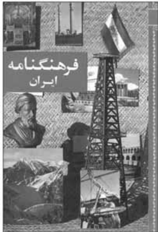
تصویر ۴: روی جلد هفدهم فرهنگ‌نامه جلد هفدهم فرهنگ‌نامه به ایران اختصاص داشت. انتشار ۱۳۴۶

«ناشر همراه» با انتشارات ابن‌سینا، نیل، امیرکبیر و حبیبی در این دوران کتاب‌های علمی متنوعی را به دست ترجمه سپرده و سپس منتشر کرده است.