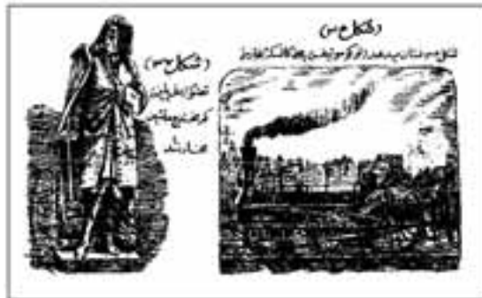
تصویر ۱: تاریخ ادبیات کودکان و نوجوانان ج ۳ ص ۲۵۴ تصویر مربوط به یک مقاله علمی در روزنامه‌ی معارف شماره ۲۲