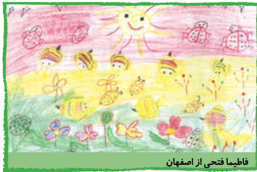
فاطمیما فتحی از اصفهان