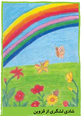
شادی لشگری از قزوین