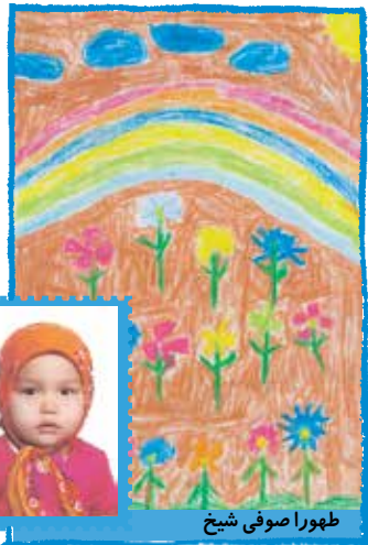
طهورا صوفی شیخ