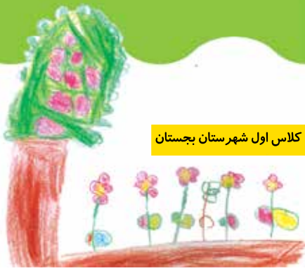
کوثر اکبری کلاس اول شهرستان بجنستان