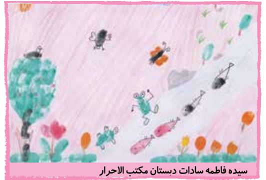
سیده فاطمه سادات دبستان مکتب الاحرار