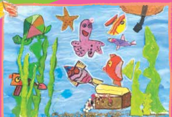
شابلین طاهری نژاد ۵ ساله