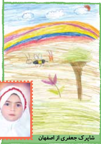
شاپرک جعفری از اصفهان