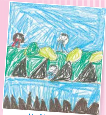
آنیسا غزنوی کلاس اول