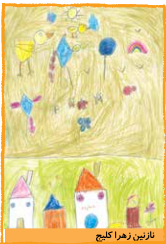
نازنین زهرا کلیچ