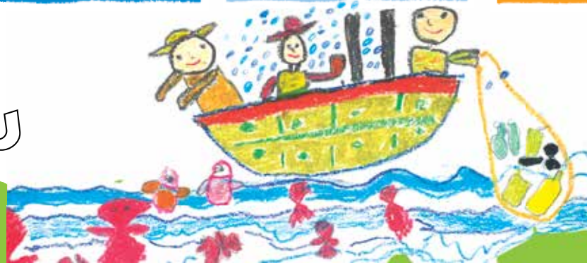
فرید رکنی از عجب شیر