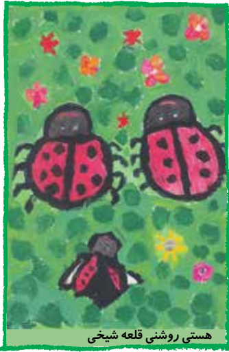
هستی روشنی قلعه شیخی