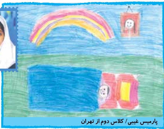
پارمیس غیبی / کلاس دوم از تهران