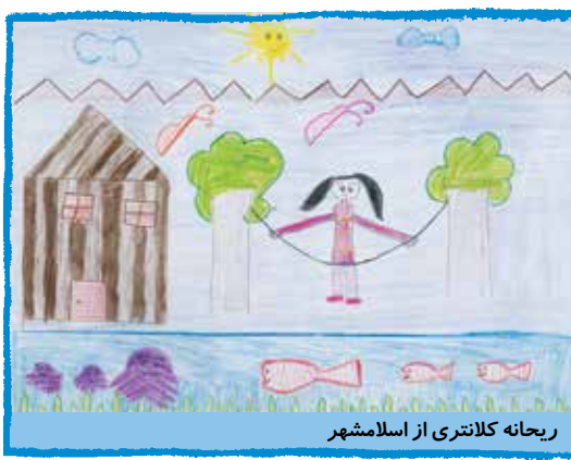
ریحانه کلانتری از اسلامشهر