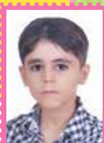
ابوالفضل یادگاری / دبستان ماه بنی هاشم (ع) از اصفهان