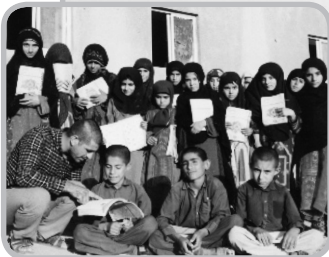
خطراه‌های تصویری با دانش‌آموزان پایه سوم (۱۳۶۳). همراه با بچه‌ها در حال تعطیل شدن مدرسه (بالا) و