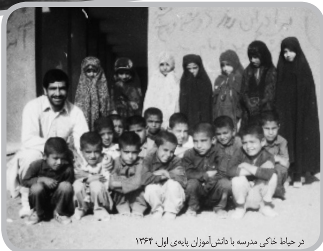
در حیاط خاکی مدرسه با دانش آموزان پایه ی اول، ۱۳۶۴