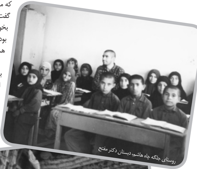
روستای جلگه چاه هاشم، دبستان دکتر مفتاح

سال ۱۳۶۲ به اتفاق یکی از همکارانم که بچه ی شهر قم بود، به