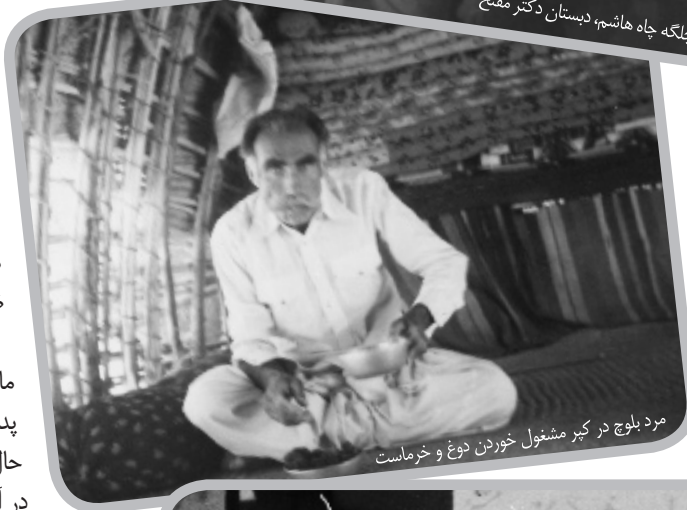
مرد بلوچ در کپر مشغول خوردن دوغ و خرماست