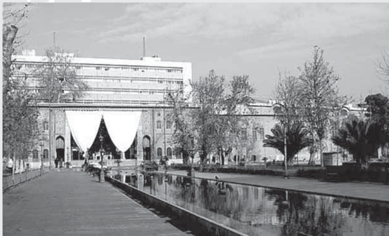
کاخ موزه‌ی گلستان

بازدید تاریخی بود. با توجه به این که تهران از دوره‌ی قاجار پایتخت ایران بوده است، اماکن فراوانی دارد که هر یک محل وقوع یکی از حوادث تاریخ معاصر ایران است و می‌تواند در راستای آموزش تاریخ معاصر مورد استفاده قرار گیرد. به علاوه، سال جاری (۱۳۸۵) مصادف با یکصدمین سالگرد نهضت مشروطه است و چندین بخش از کتاب تاریخ معاصر ایران نیز به بررسی زمینه‌ها و چگونگی شکل‌گیری مشروطه و حوادث متفاوتی اختصاص دارند که به صدور فرمان مشروطه توسط مظفرالدین شاه قاجار انجامید. از این رو، انتخاب مجموعه‌ی مجلس به‌عنوان ثمره‌ی اصلی نهضت مشروطه و خانه‌ی ملت، و مجلس شورای ملی در طول دوران مشروطه و پس از آن، و هم‌چنین لمس و دیدار از این مکان، برای آنان که به نوعی دستی در تاریخ معاصر دارند، به خصوص دبیران این رشته، مشرثر خواهد بود و انتخابی شایسته و قابل ستایش است.