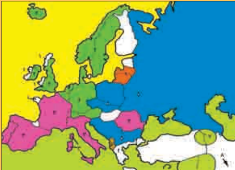
قلمرو جغرافیایی خانواده‌ی زبانی هند و اروپایی

اروپایی» می‌پردازیم. حدود صد زبان در این خانواده‌ی زبانی قرار گرفته‌اند که از لحاظ تعداد، خانواده‌ی بزرگی پانزدهم میلادی، در آمریکا و آفریقا و اقیانوسیه نیز رواج یافت. قلمرو جغرافیایی خانواده‌ی زبانی هند و