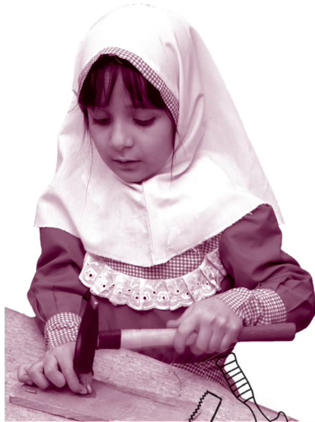
از مؤسسه فرهنگی آموزشی پیشگامان مدرسه فرادا