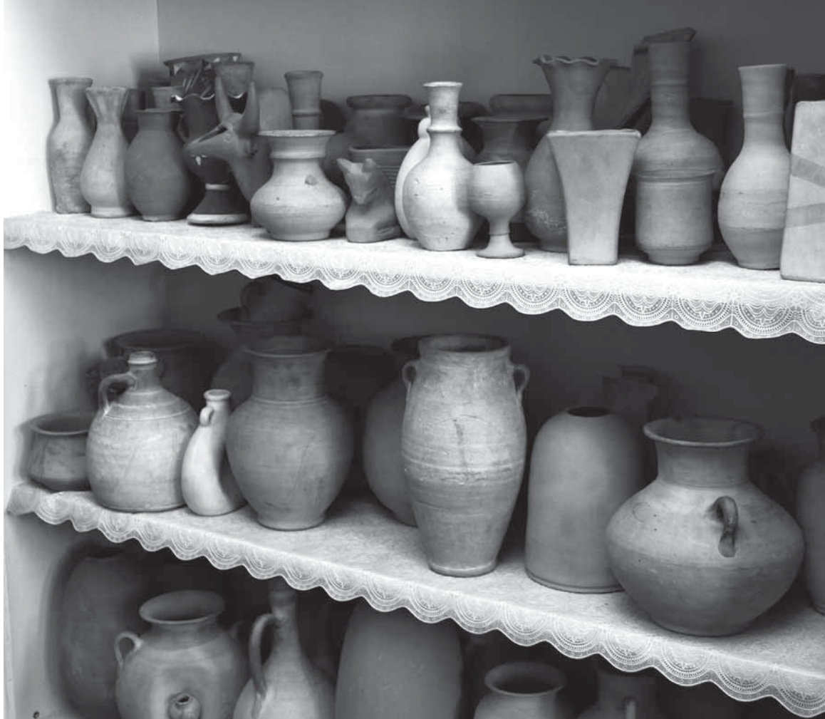
قسمتی از آثار سفالی هنرجویان