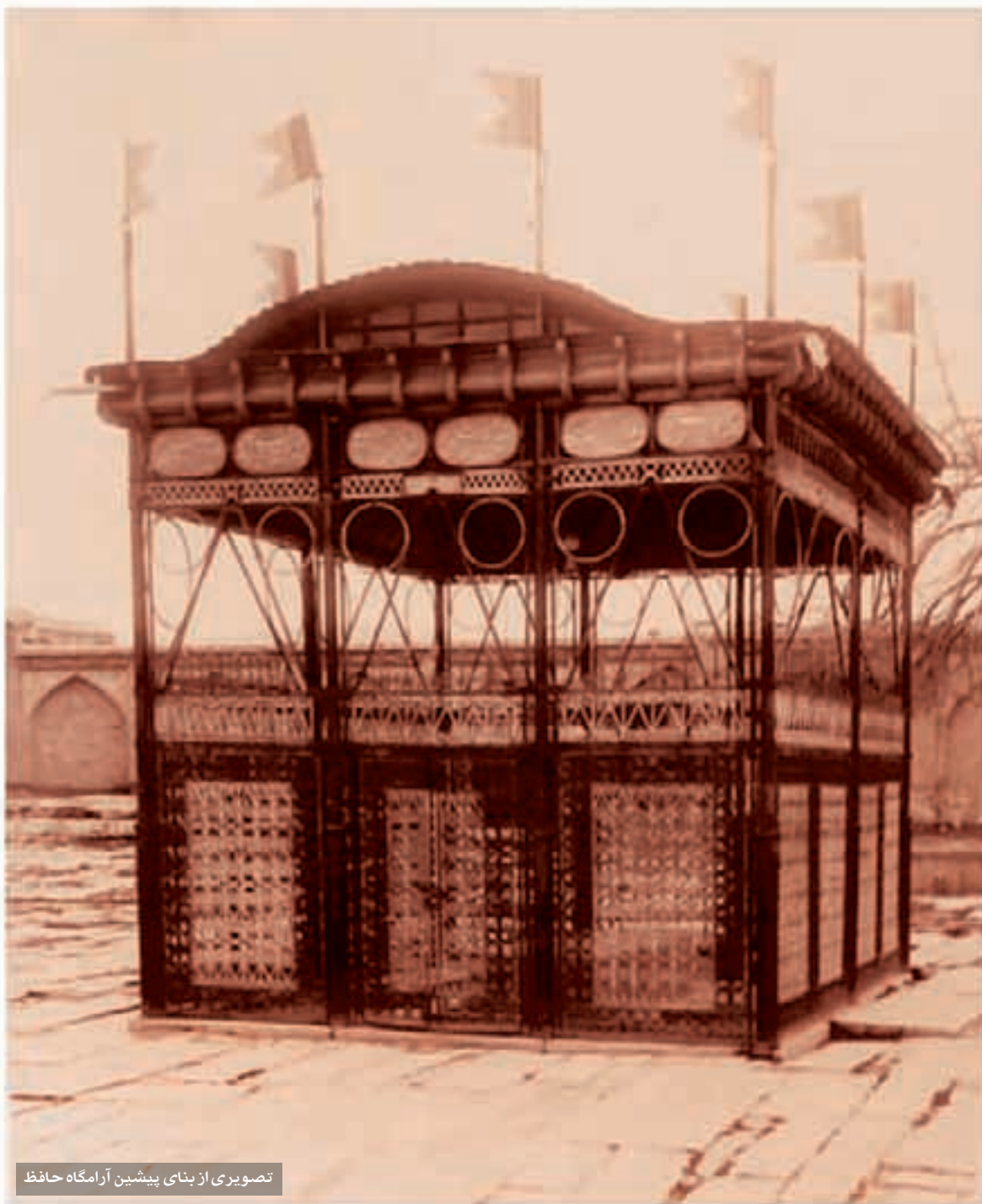
تصویری از بنای پیشین آرامگاه حافظ

زان یار دلنوازم شکریست با شکایت بی‌مزد بود و منت هر خدمتی که کردم رندان تشنه لب را آبی نمی‌دهد کس در زلف چون کمندش ای دل مپیچ کانا چشم‌ت به غمزه‌ما را خون خوردومی پسندی در این شب سیاهم کم گشت راه مقصود از هر طرف که رفتم جز وحشتم نیفزود ای آفتاب خوبان، می‌جوشد اندروم این راه را نهایت، صورت کجا توان بیست؟ هر چند بردی آبم، روی از درت نتابم عشقت رسد به قریب از خود بسان حافظ